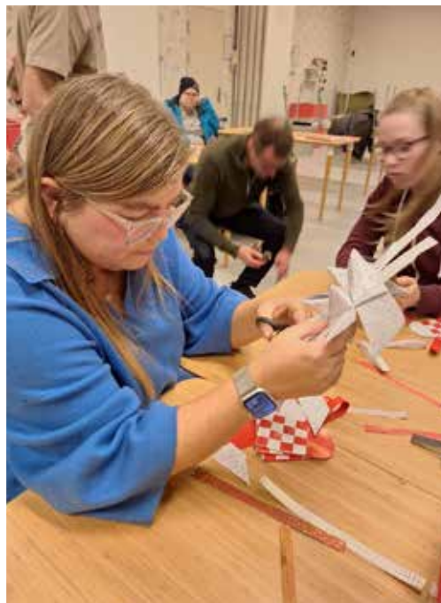
Vi laver julepynt.

Der blev dog også tid til en tur i biografen hen over efteråret, hvor vi så den danske film "Hygge".